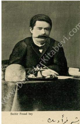
Beşir Fuad bey

Fuat'ın hiç tammadığı babası, gerçek bir tarihi karakter olan Türk asker, yazar ve düşünürü Beşir Fuad'tır. Hugo ve Voltaire ile ilgili inceleme kitaplarıyla tanınan Beşir Fuad, annesinin delirmesinden sonra girdiği bunalm ve korkunç intiharıyla ses getirmiştir. Beşir Fuad, annesi gibi delirme korkusuyla bileklerini kesmiş ve ölümüne kadarki yaşadıklarını an be an kaleme almıştır. Ahmet Mithat Efendi, Beşir Fuad ile ilgili biyografik bir kitap yazmıştır. Kitabın sonlarına doğru, babasının hazin hikayesini öğrenen Fuat'ı da aynı korkular ve hezeyanlar saracaktır.