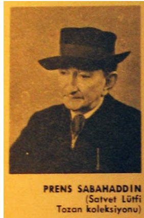
PRENŞ SABAHADDİN